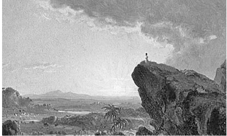
摩西在山上观看迦南地

摩西奉神的差遣，领以色列出埃及，经过旷野四十年，传律法给他们，是宗教礼仪，法制的创始人。但耶和華很早就预先告诉摩西，他因为在米利巴犯的错误的，不得进入迦南应许之地。现在到了约但河的边上。隔水遥望，落日金黄的余暉，越过跃动的水波，照着西方荣美的迦南地。